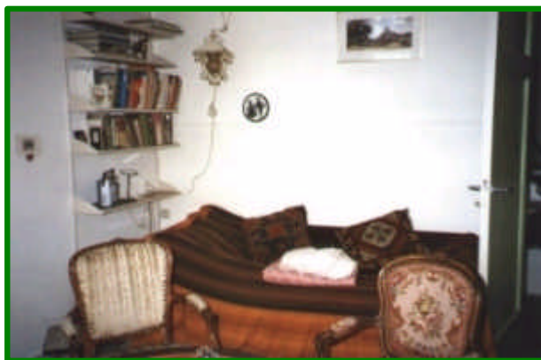
De slaapkamer van Margot en Anne Frank. Het logeerbed staat op dezelfde plaats waar Anne's bed gestaan heeft.